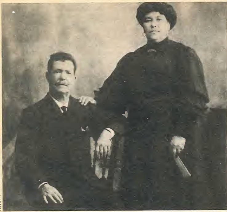
El Rojo «El Alpargatero», con su esposa, a finales del siglo XIX. El fue quien invitó a don Antonio Chacón a visitar La Unión.